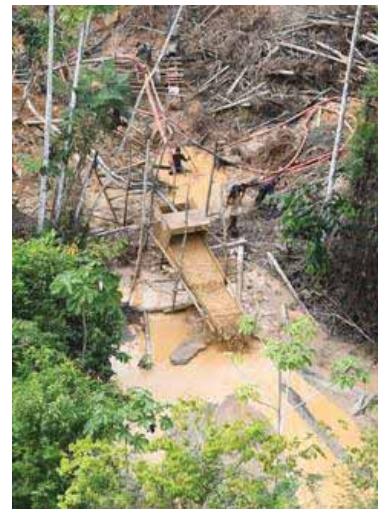
Lipo Lipo : table de levée (04/08/2017)