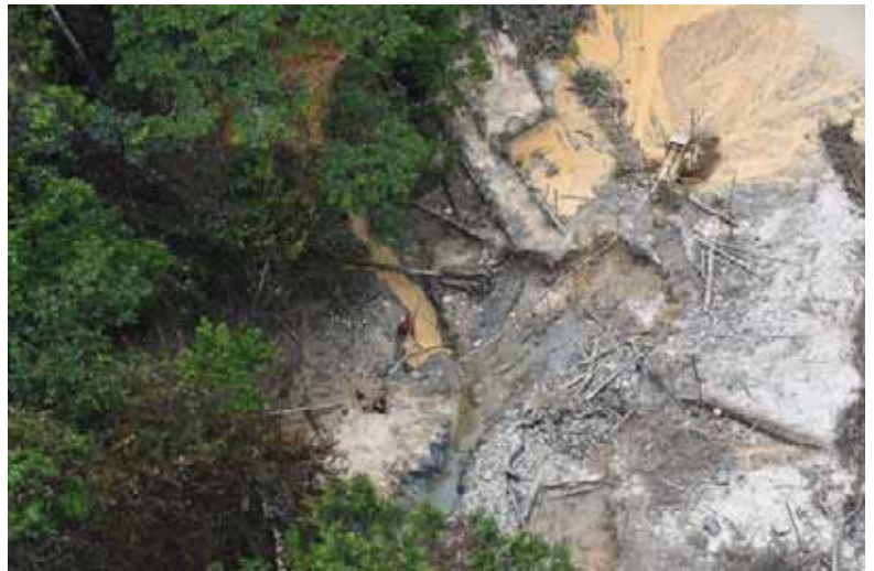
Emerillon : chantier (08/08/2017)

Après les survols de mars 2017 nous soulignons la relative stabilité depuis 2,5 ans du nombre de sites à 25 en moyenne (après une période de plus forte activité entre mars 2013 et mars 2014 avec 31 sites actifs en moyenne). La situation s'est très fortement dégradée sans qu'aucun secteur ne cristallise une dégradation spectaculaire. L'augmentation est diffuse sur l'ensemble des secteurs habituellement travaillés par les garimpeiros. Cette campagne a permis d'inventorier non pas un épiphénomène résultant d'une ruée subite sur de nouveaux secteurs mais bien une activité de fond, installée sur des secteurs durablement orpaillés.