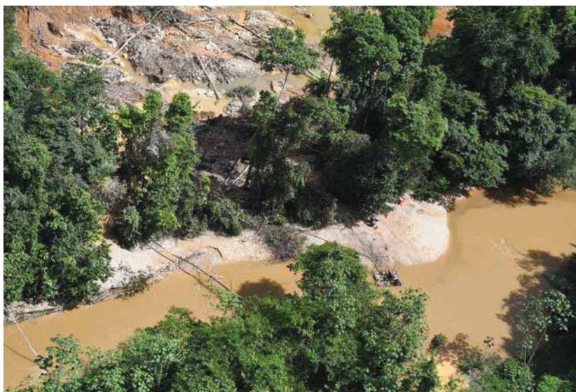
Petit Abounami : chantier. Crique très turbide (03/08/2017)