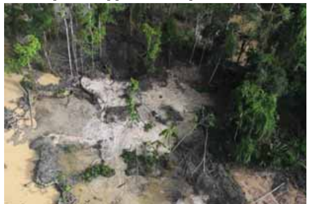
Alicorne : chantiers (09/08/2017)