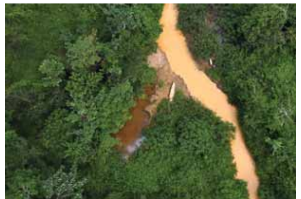
Crique Eau Claire : très forte turbidité (09/08/2017)