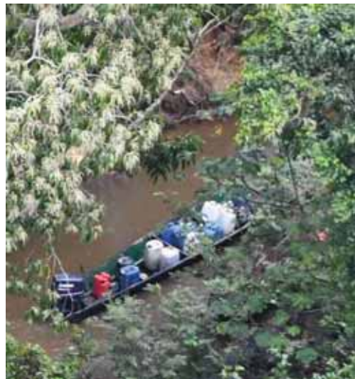
Palofini : logistique carburant (09/08/2017)