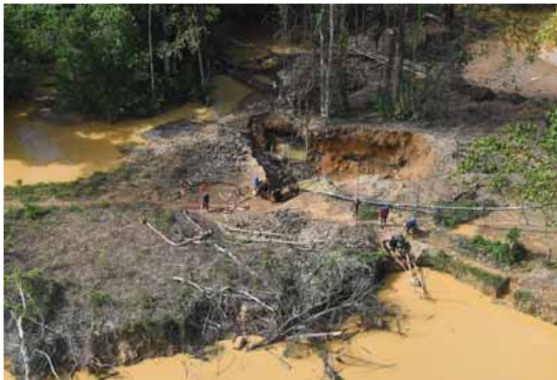
Pakira : chantier (09/08/2017)