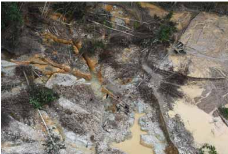
Monts Hocco : chantier (04/08/2017)

Le niveau d'activité est particulièrement dramatique sur ce secteur qui impacte directement les populations des villages amérindiens. L'activité se concentre sur les secteurs orpaillés depuis des années, il ne s'agit pas d'une surprise mais cela démontre notre incapacité collective à tenir le terrain et à harceler l'adversaire pour l'empêcher de s'installer.